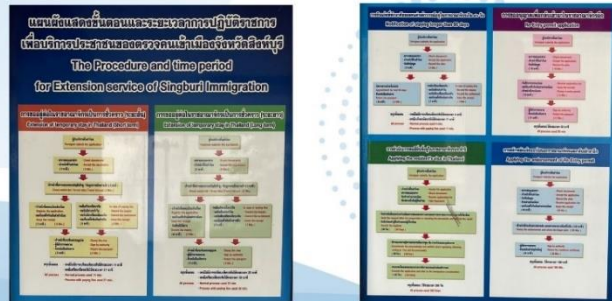
มีป้ายพับระสัญญา ขั้นตอนการให้บริการ ทั้งภาษาไทยและภาษาอังกฤษ