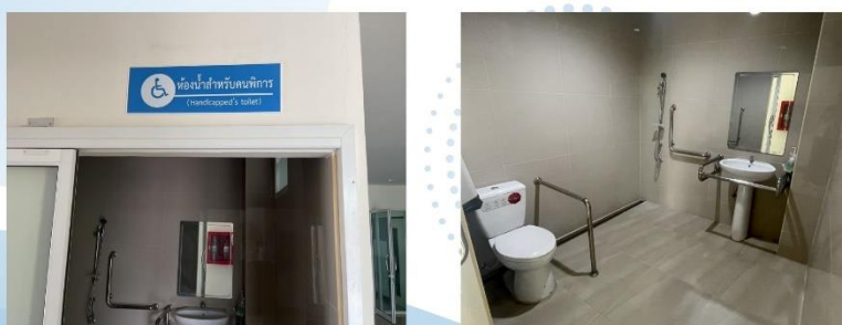
ห้องน้ำสำหรับผู้มาติดต่อแยกประเภทสำหรับผู้พิการ ติดป้ายสัญลักษณ์สากล