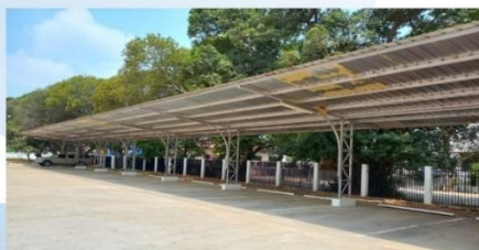
ที่จอดรถยนต์