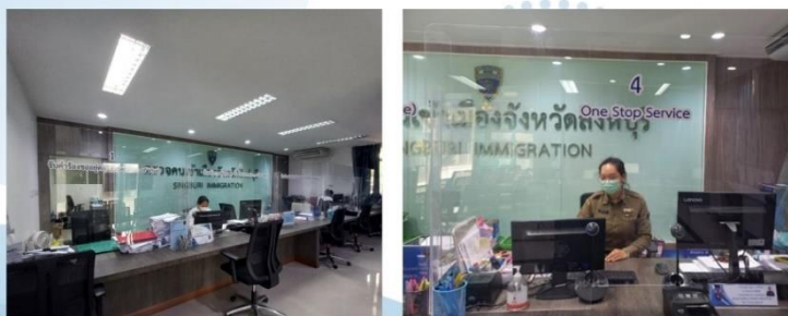
ภาพป้ายประชาสัมพันธ์ติดตั้งให้ผู้มารับบริการ (ประชาชน/ชาวต่างชาติ) สามารถเห็นได้อย่างชัดเจน