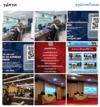
ความเป็นส่วนตัว · ซ้ำกันหมด · ลวโรซหมา · ส่วนลึกโรซหมา [p] · ลกั · เพิ่มใหม่ · Meta © 2024