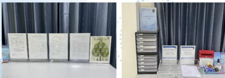
ภาพป้ายประชาสัมพันธ์ติดตั้งให้ผู้มารับบริการ (ประชาชน/ชาวต่างชาติ) สามารถเห็นได้อย่างชัดเจน