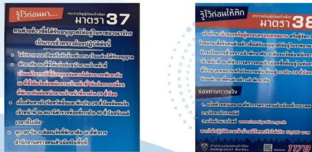
ภาพป้ายประชาสัมพันธ์ติดตั้งให้ผู้มารับบริการ (ประชาชน/ชาวต่างชาติ) สามารถเห็นได้อย่างชัดเจน