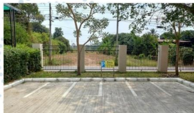
ที่จอดรถจักรยานยนต์

มีสถานที่จอดรถยนต์และรถจักรยานยนต์ให้ผู้มาติดต่อราชการ