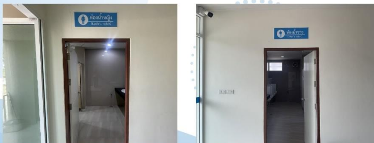
ห้องน้ำสำหรับผู้มาติดต่อแยกประเภทผู้ชายและผู้หญิง ติดป้ายสัญลักษณ์สากล