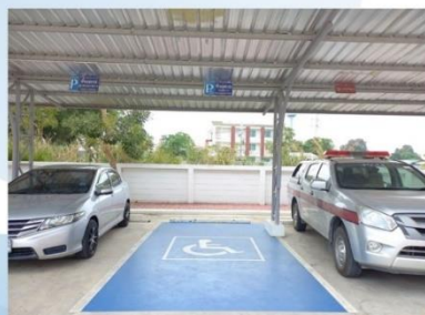
ที่จอดรถยนต์